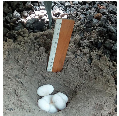
Foto's: Binnen het Schildpaddencentrum worden wel eieren gelegd, maar...

Laat de Belastingdienst meebetalen aan je donaties! Afhankelijk van je inkomen is een zogeheten periodieke schenking aftrekbaar van de belasting (er geldt hiervoor een drempel, de hoogte hiervan wordt jaarlijks bepaald door de Belastingdienst).